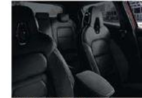
PACK N-DESIGN - CHIC BLACK - EN OPTION Cuir partiel Black avec inserts Black