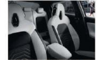
PACK N-DESIGN - LIFESTYLE WHITE - EN OPTION Tissu gaufré Black avec inserts PVC.