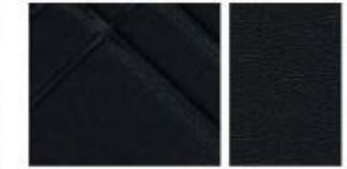
TEKNA STANDARD Tissu Noir/Tissu Noir