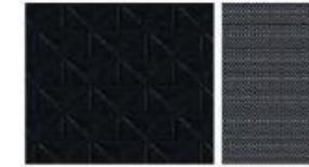
N-CONNECTA ET N-DESIGN STANDARD Tissu Noir/Tissu Noir