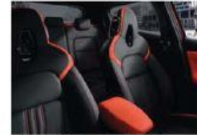
PACK N-DESIGN - ACTIVE ORANGE - EN OPTION Cuir partiel Black avec inserts Orange